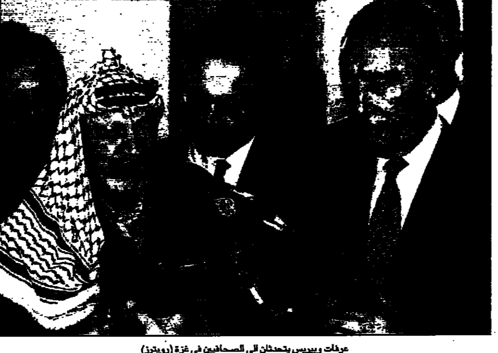
عزرايت وبييريس يتحدثان في غزة